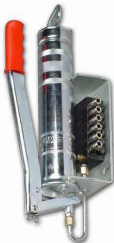
HP 500 W-SSV