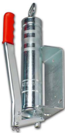
HP 500 W