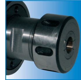
Sporgenza per pinza ER 25 Nose type for collet ER 25

NB: Pinza e ghiera vengono fornite a richiesta. NB: Collet and ring nut only on your request.