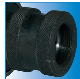
Sporgenza per cono morse 2-3 Nose type for MK 2-3

NB: Posizione morsetti standard come da posizione "A" con forature lato largo. Su richiesta in posizione "B" con forature lato stretto. NB: Standard terminal box in "A" position with fixing holes on wide part. On request terminal box in "B" position with fixing holes on narrow part.